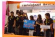
キングモンクット工科大学バンコクの生徒 "RRP Raddater"チーム