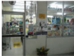
[スクンビット・ソイ29]

[スクンビット店] スクンビット・ソイ29 月～金 8:30～18:30 (土・日 8:00～17:00) Tel:0-2258-0320 Ext.1570, Fax:0-2259-9116, tpab_s@tpa.or.th