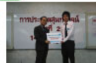
スロバセー・プラトマー・ニットさん 「ニュースの衝撃的な写真はみんなに大嫌いのぞ」