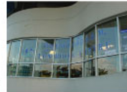
[パタナカーン・ソイ18]

[スクンビット店] スクンビット・ソイ29 月～金 8:30～18:30 (土・日 8:00～17:00) Tel:0-2258-0320 Ext.1570, Fax:0-2259-9116, tpab_s@tpa.or.th