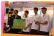
ラーマキーウィットヤム高校 "Kanji S.M.S.A"チーム

今大会は、Toyota Motor Thailand、NSK Asia Pacific Technology Center (Thailand)、Mitsubishi Electric Automation、NHK Spring (Thailand)、FA Tech、Denso International (Thailand)、Toyota Boshoku、Toyota Gosei Asia、Toyota Gosei Rubber (Thailand)、財団法人JKA、他各社のご協賛を得て開催いたしました。協賛いただきました企業の皆様に厚く御礼申し上げます。