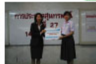
プレートーン・シー・ティ・ソンス 「かならずいじごがある」