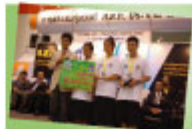
チュラボンラーチャンタヤライ高校 "Wandana"チーム