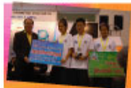
アヌクーンナラー高校 "ANR SMART"チーム