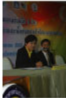
クンジン・カンヤー・ソーポンパニット 科学技術省長官

タイ国立標準研究所(NIMT)、環境・科学技術省科学サービス局、砂糖委・砂糖委員会、事務局(OCSB)ならびに泰日経済技術振興協会(TPA)は、タイの重要な産業のひとつである製糖・精糖業界の実験検査室の品質の向上、検査基準の標準化などを目指し覚書(MOU)を締結しました。