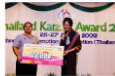
Mr. サップ・バーンダーン 「コイルバネ基準チェック機」 Bangkok Spring Industrial