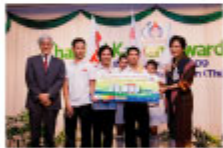
「自動ねじ締め機」Hitachi Global Storage Technologies (Thailand)