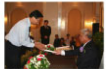
TPAチャテュポーン校長