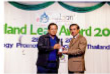
Team Precision Public