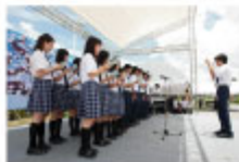
昨年開校したタイ初の日系高等学校 如水館の1年生による合唱