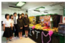
学生達による模擬店や展示・デモンストレーション