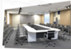
Meeting room : L Size (20-30 Seats)