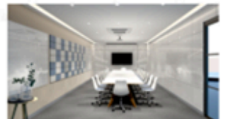
Meeting room : M Size (14 Seats)