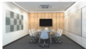
Meeting room : S Size (8 Seats)

スマートディスプレイ、高音質の音響設備、高速インターネットなど、充実した設備を完備しております。 少人数から大人数まで、目的や規模に応じてお選びいただける各種会議室をご用意しております。